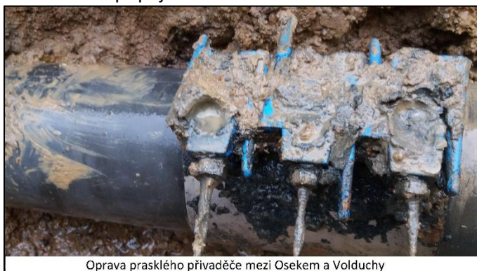
Oprava prasklého přivaděče mezi Osekem a Volduchy

Větší příděl srážek během letošního chladnějšího léta pomohl vodním zdrojům obce Osek a nebylo tak potřeba více omezovat spotřebu pitné vody v oseckých domácnostech. Odlišná situace bohužel nastala v části obce Vitinka, kde dlouhodobé sucho zapříčinilo významný úbytek vydatnosti stávajícího zdroje, a ani častější deště nepřinesly podstatné zlepšení. V letních měsících musela být pitná voda do vitinského vodovodu dovážena a je potřeba velice poděkovat oseckým hasičům, kteří dovoz vody zajišťovali.