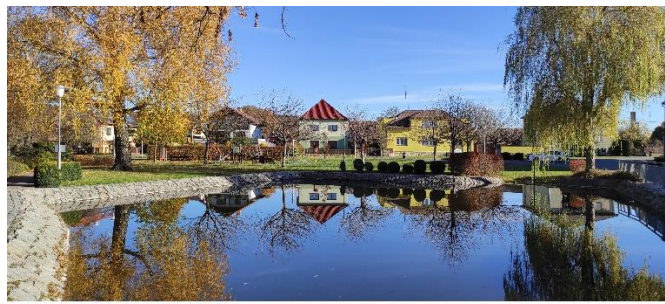
autor: Bc. Zahradková Laura, DiS.