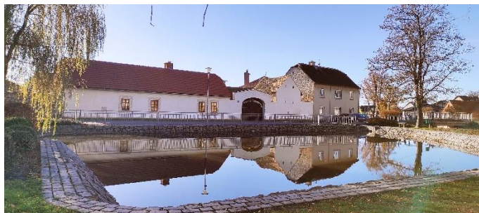
autor: Bc. Zahradková Laura, DiS.