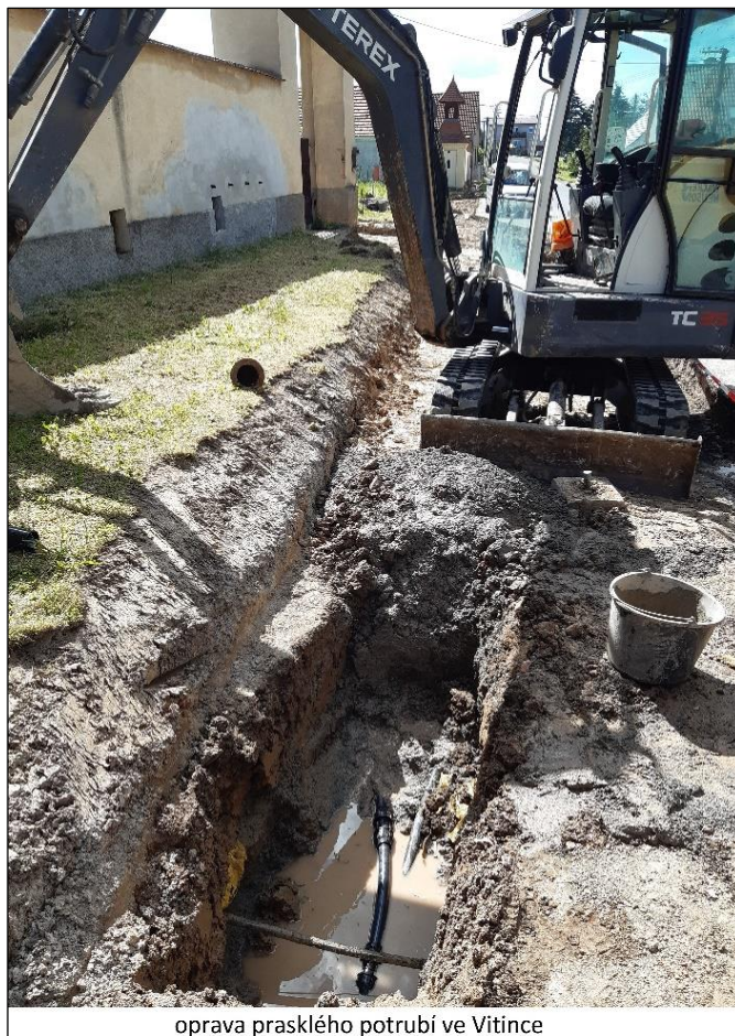
oprava prasklého potrubí ve Vitince

Letošní rok byl pro Oseckou obecní vodárenskou s.r.o., stejně jako pro většinu lidí, náročným rokem. I přes problémy z minulých let, personální změny a koronavirová omezení byla pitná voda dodávána do oseckých a vitinských domácností téměř bez přerušení. V roce 2019 bylo z oseckého vodovodu odebráno necelých 39 tis. m 3 pitné vody. Předpokládáme, že ve srovnání s loňským rokem, překročí letos množství odebrané pitné vody z vodovodu Osek 40 tis. m 3 . Důvodem bude nejen skutečnost, že trávíme doma mnohem více času než obvykle, ale také neustále se zvyšující počet nových odběratelů pitné vody. Jen od června 2020 bylo v Oseku vybudováno 8 nových vodovodních přípojek.