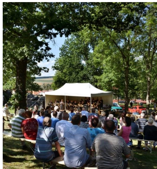
Koncert Hrádeckého Big bandu na Kamýku