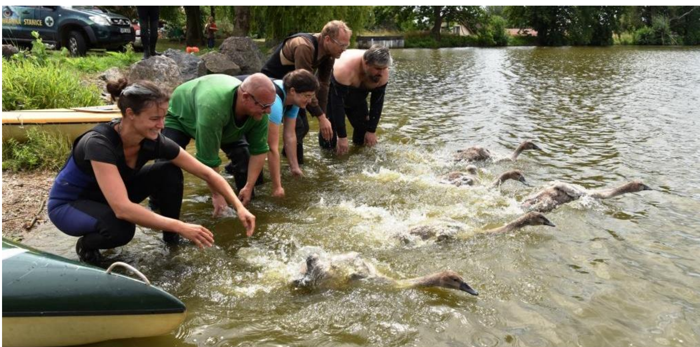
Vypouštění okroužkovaných labutí na Karásku