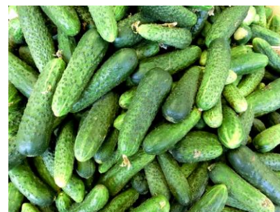
ZO ČZS Osek

Doufáme, že rok 2016 bude optimálně klimaticky nastaven a kvalitní výpěstky obohatí jídelníček.