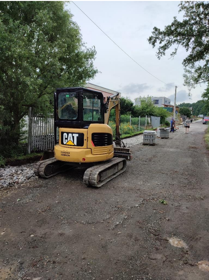
Výstavba chodníku a oprava komunikace u Kněžského rybníka