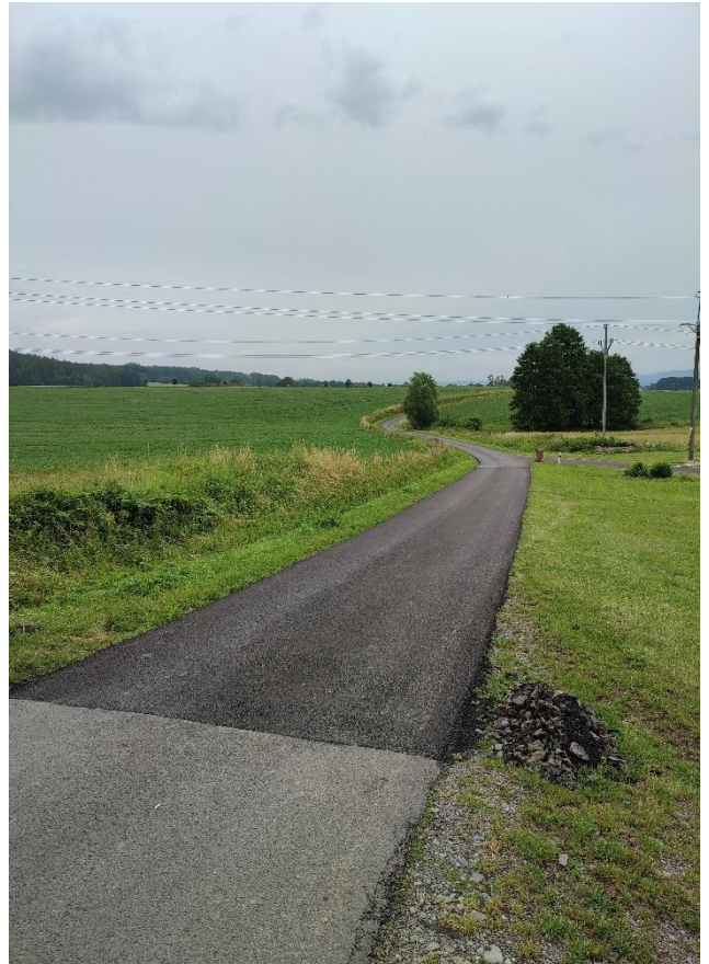
Opravená komunikace od požární nádrže k hlavní silnici směr Osek-Březina