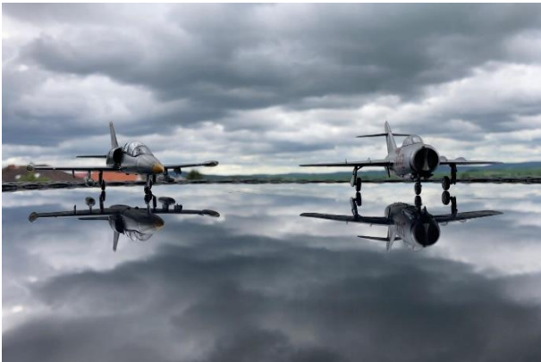
L-39 Albatros a Mig-15

Od začátku školního roku 2021/2022 se scházíme v klubovně každý pátek v době od 17 do 20 hodin. V současné době se pravidelně schází 11 modelářů a jedna modelářka. Mnozí modeláři již dokončili některé z modelů letadel Mig-15 a L-39 Albatros, proto můžete alespoň některé modely vidět na přiložených fotografiích. Na dalších fotografiích můžete vidět a potěšit oko povedeným modelem závodního vozu Lago Talbot a také historického vozu Packard Laudalet. Neméně povedeným modelem je taktéž stíhací bombardér Suchoj Su-7 a druhoválečný palubní stíhací letoun Vought F4U-2 Corsair se svými charakteristickými křídly ve tvaru W.