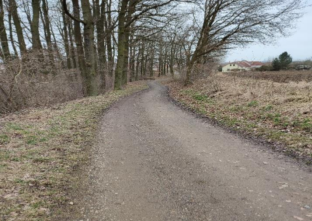
Současný stav komunikace ke kompostárně

Letos jsme získali dotaci od Plzeňského kraje v částce 500 000 Kč na rekonstrukci komunikace ke kompostárně. Tyto dotace významně pomáhají v rozvoji obcí, považuji za velký úspěch, že se nám téměř každý rok daří tyto dotace získat.