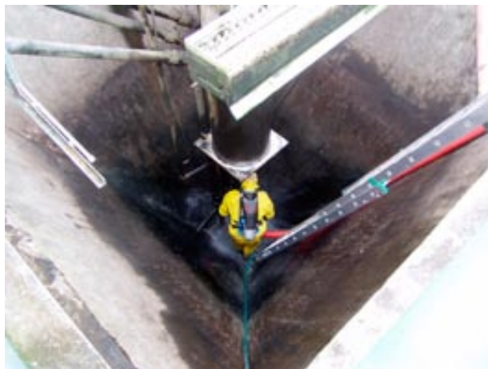
Oprava čerpadla v dosazovací nádrži ČOV - provedli hasiči z Oseka.

Na ČOV v letošním roce kromě energie narostla i položka na opravy. Zařízení je v provozu již osm let, takže se začala projevovat jeho únavy. Bylo třeba vyměnit motor a ložiska u vzduchových dmychadel, bylo nutné opravit jedno míchadlo na kal a dvě čerpadla na kal. Největší položkou je výměna kyslíkových čidel, která měří obsah kyslíku v nádržích a regulují provoz dmychadel. Na ČOV Osek jsou namontována dvě s životností 6 let. Výměna jednoho stojí zhruba 42.000,- Kč. V letošním roce jsme vyměnili jedno, na počátku roku 2009 vyměníme druhé. I tady je třeba do budoucna počítat s nárůstem ceny pro stočné. Na místě je třeba připomenout, že kanalizační stoky a jejich opravu a údržbu zajišťuje a nese ke své tíži každá z obou obcí. Kolik vynaložila na opravy a údržbu kanalizačních stok obec Volduchy nevíme, ale obec Osek za poslední dva roky, kdy bylo třeba zrevidovat a opravit kanalizační stoky před opravou komunikací, vynaložila na opravy, tlakové vyčištění a kamerové prohlídky přes 200.000,- korun. To jsou ve stručnosti nejdůležitější problémy, se kterými se obec na poli provozování vodovodu a kanalizace potýká.