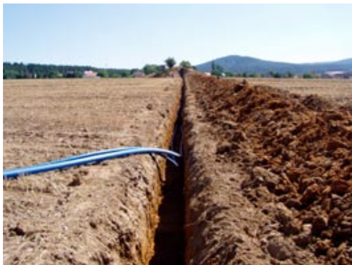
Pokládka potrubí mezi vodojemy.

Vážení odběratelé, uběhl další rok, kdy obec Osek zajišťovala dodávku pitné vody pro obce Osek a Volduchy. Jak už uvedl starosta ve svém článku, neustále máme nedostatek podzemní vody, neustále musíme knotrolovat hladiny ve vodojemech a střídavě regulovat přítok a odtok do spotřebišť. Nepříjemnou situaci řešíme hledáním nových nebo dosud nevyužívaných vodních zdrojů. V loňském roce jsme připojili do systému vrt u studánky v Habru a doufali jsme, že máme alespoň na několik let vystaráno. Bohužel hladina spodní vody klesá a spotřeba naopak stoupá.